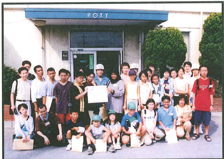
ホクシー東京工場入口にて