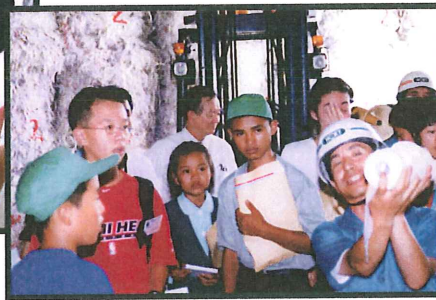
後ろに切り刻まれた古紙がまとまって、山積みされています。